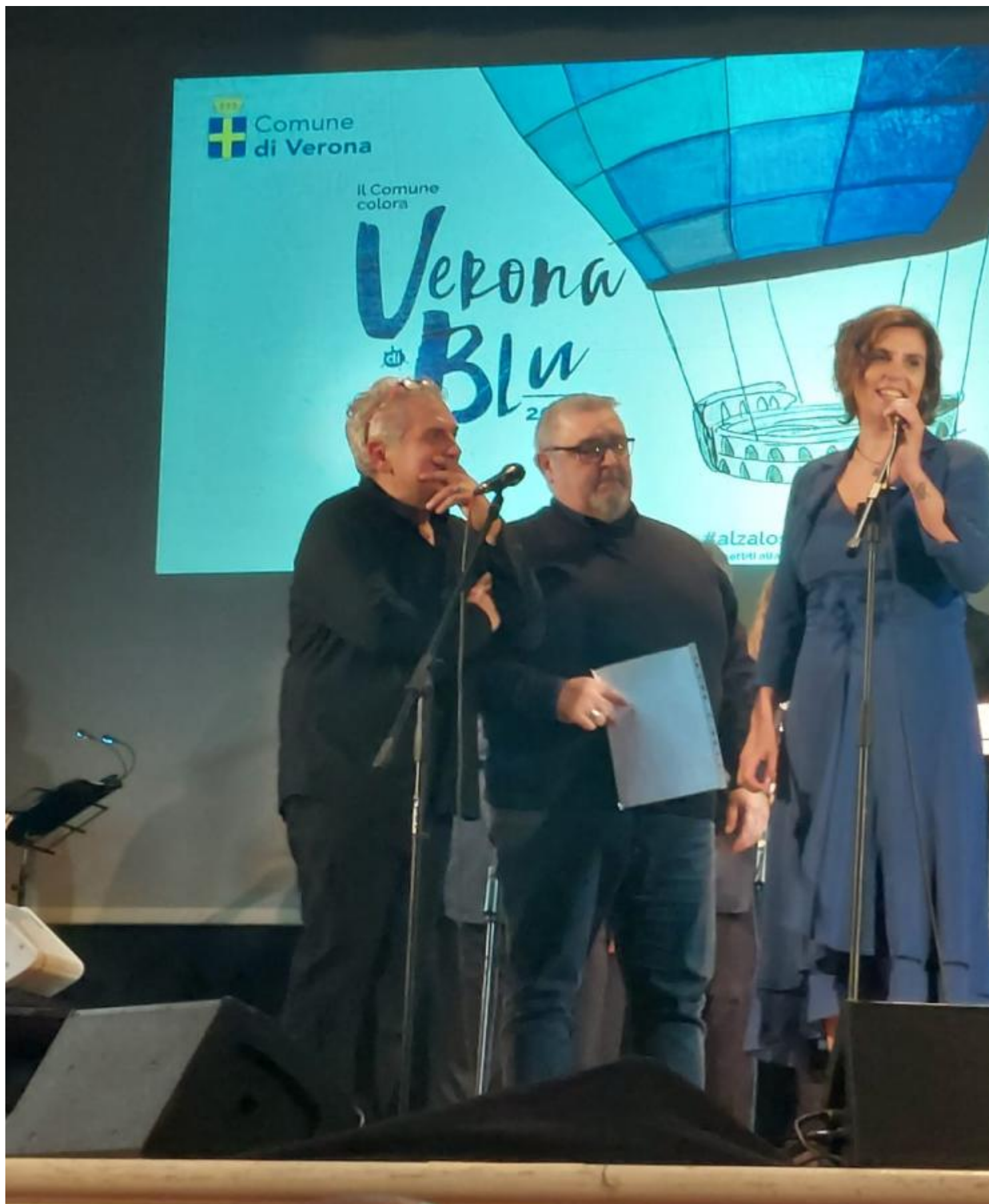
Il 15 aprile, al Teatro della scuola Fortunata Gresner di Verona, una grande presenza di pubblico ha assistito al concerto del "T'ho trovato vocal group" che si è esibito a favore degli